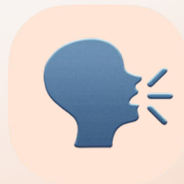
Casos de assédio

De situações pessoais a irregularidades. Ofereça às suas equipas um lugar seguro onde tenham voz.