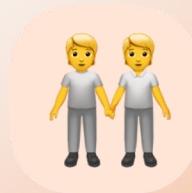
Diversidade & Inclusão